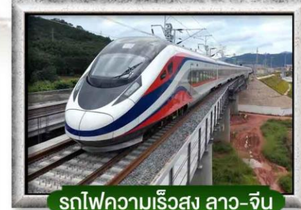
รถไฟความเร็วสูง ลาว-จีน